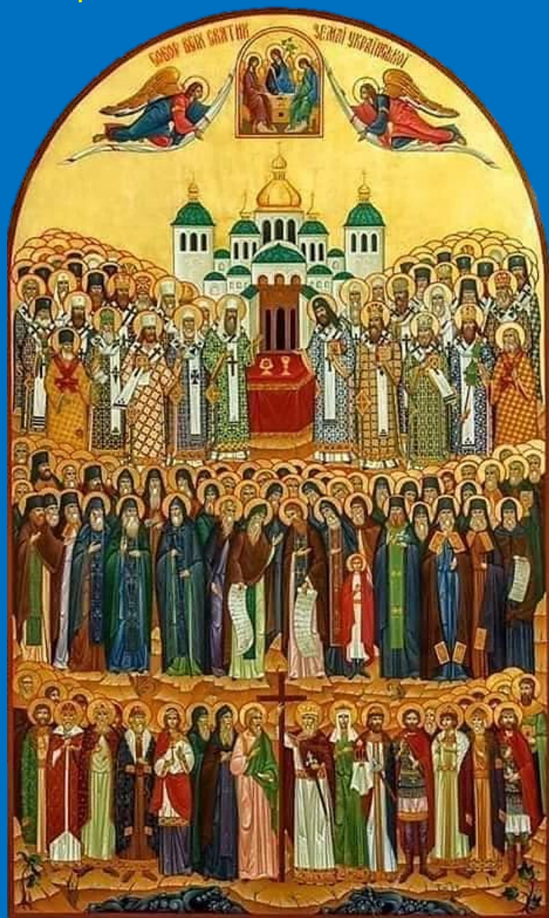
Друга Неділя після П'ятидесятниці Неділя Всіх Святих Землі Української та Американської