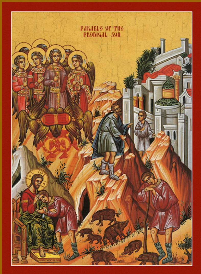
PARABLE OF THE PRODIGAL SON

MARCH 3, 2024 Sunday of the Prodigal Son Неділя про Блудного Сина