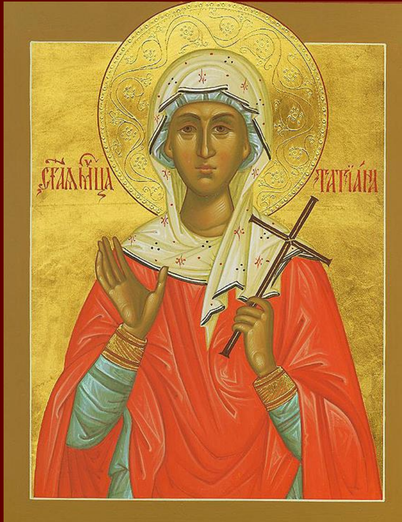
Martyr Tatiana of Rome – мч. Татіани Римлянки

Sunday after Theophany Неділя після Богоявлення