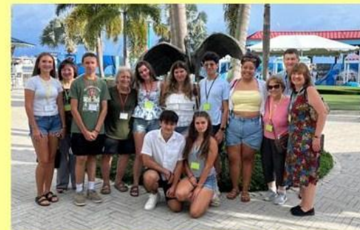
Члени UOL на з'їзді у 2025 році

Статус члена за загальним правом також доступний будь-якій особі, яка є членом Церкви, але не проживає в географічній зоні місцевого відділення УПЛ.