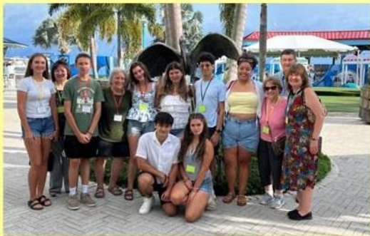
UOL members at the Convention in 2025

Member-at-large status is also available to any individual who is a member of the Church, not residing within a geographical area of a local UOL Chapter.