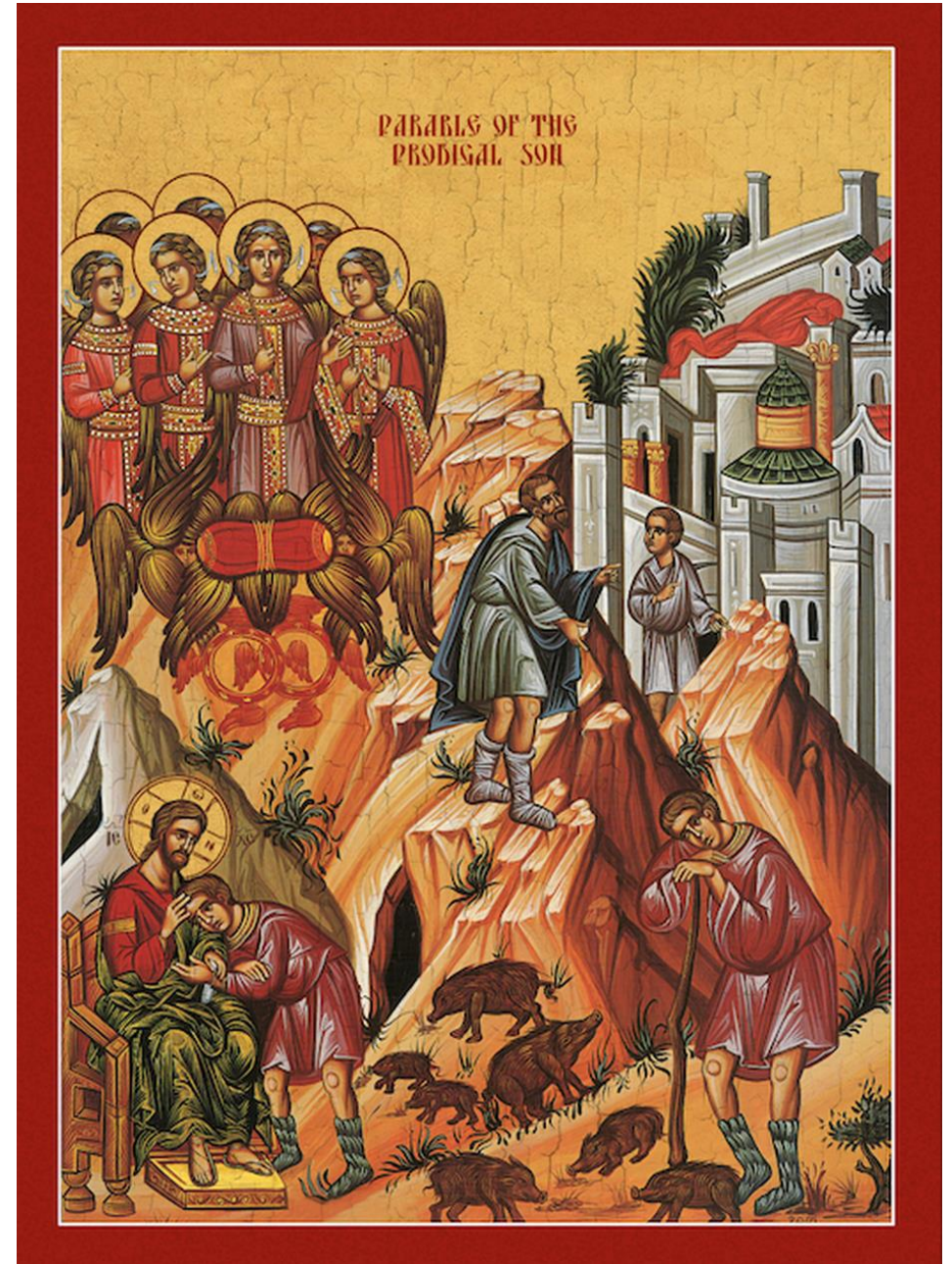
Неділя про Блудного Сина